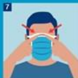
7. Mótaðu málmklemmuna að nefi.