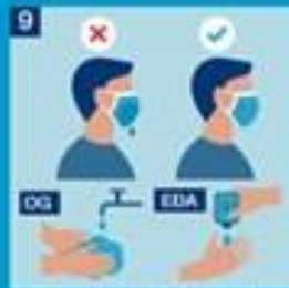
9. Gríma er notuð að hámarki í 3-4 klst. en skipt tytt ef hún er orðin rakamestuð eða menguð. Skipt er um grímu þegar sjúklingi í einangrun hefur verið sinnt. Skurðstofugríma er ekki endurnytt.