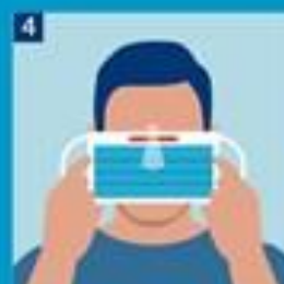
4. Málmklemma er á eftir brún grímu. Leggðu grímu að anditi með málmklemmuna yfir nefið.