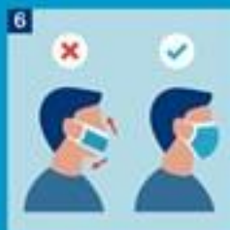
6. Hægreddu grímu undir höku og yfir nef þannig að hún falli vel að anditi.