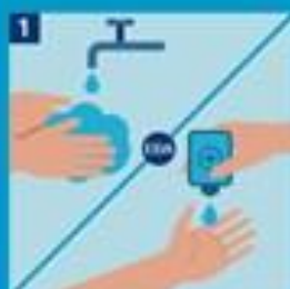
1. Hreinsaðu hendur áður en þú tækir nýja gríma.