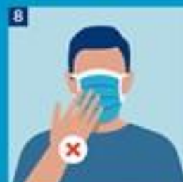
8. Forðastu að snerta grímuna á anditinu. Hreinsaðu hendur ef hún er snert.