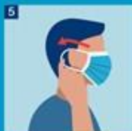
5. Kræktu teygjum bak við eyru eða fnyttu böndin, efi bönd tytt ofan eyru og meðri bönd tytt neðan eyru.