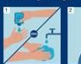
1. Hreinsaðu hendur.