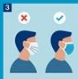
3. Láttu stuðu höfna snúa út.